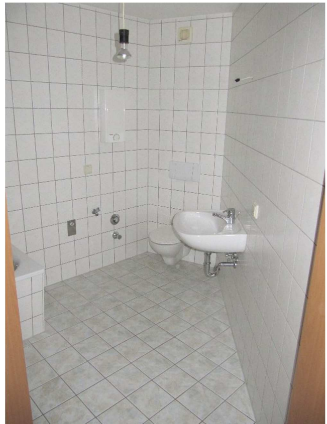
Bad / WC