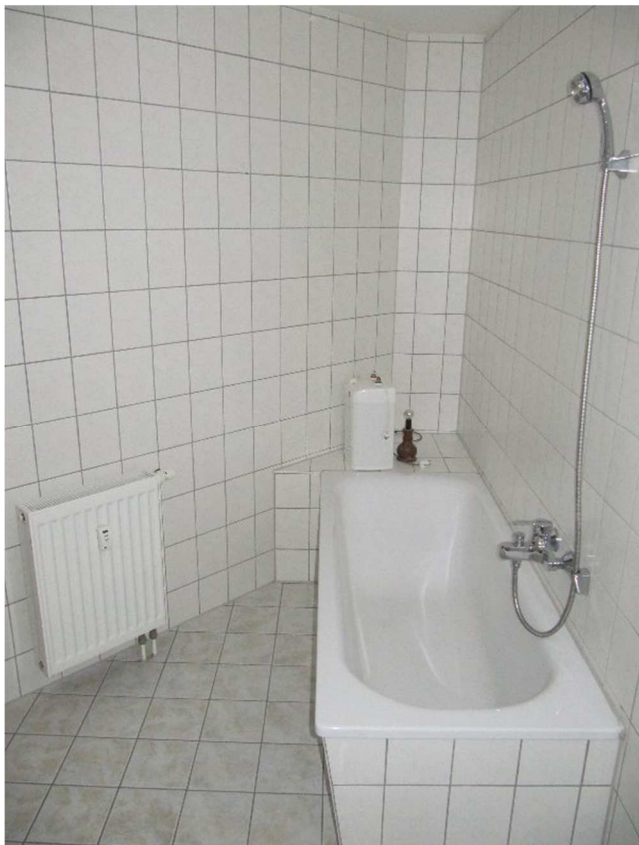
Bad / WC